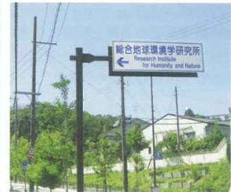
地球研正門前に標識があります